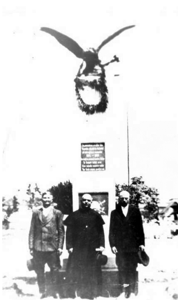
Cei trei membri ai comitetului de inițiativă. Fotografia este realizată la inaugurarea monumentului

Pe a doua placă era un basoreliev. Pe soclu se afla un vultur cu o cruce în cioc și sceptru în gheară, cu o mărime de 1,65 m și o greutate de