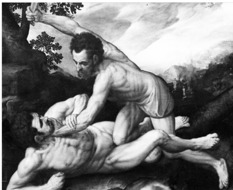
Cain îl ucide pe Abel

Iar femeia a zis către șarpe: Noi putem mânca din roada pomilor raiului, dar din roada pomului care este în mijlocul raiului, ne-a zis Dumnezeu: Din el să nu mâncați, nici să vă atingeți de el, ca să nu muriți!” (Facere 3,1-4). Diavolul prezentându-L femeii pe Dumnezeu ca o ființă fricoasă, în cele din urmă ea a cedat și a mâncat din pomul cunoștinței binelui și răului și i-a dat și lui Adam și a mâncat și el, iar aceștia, nerecunoscându-și păcatul, și-au