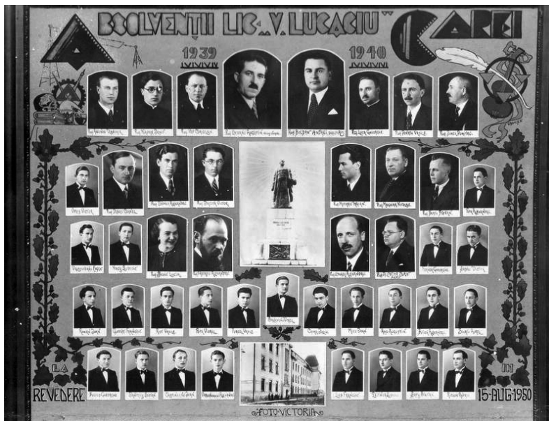
Absolvenții promoției 1939 a Liceului „Vasile Lucaciu” din Carei